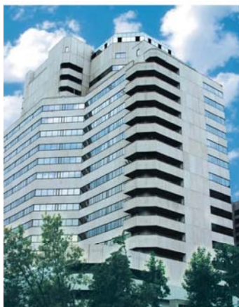
МОСКВА Краснопресненская наб.12, ЦМТ-II