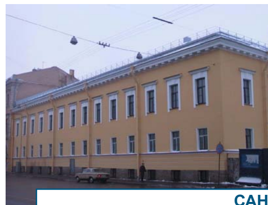
САНКТ-ПЕТЕРБУРГ ул. Шпалерная, 54 Бизнес-центр «Золотая Шпалерная»